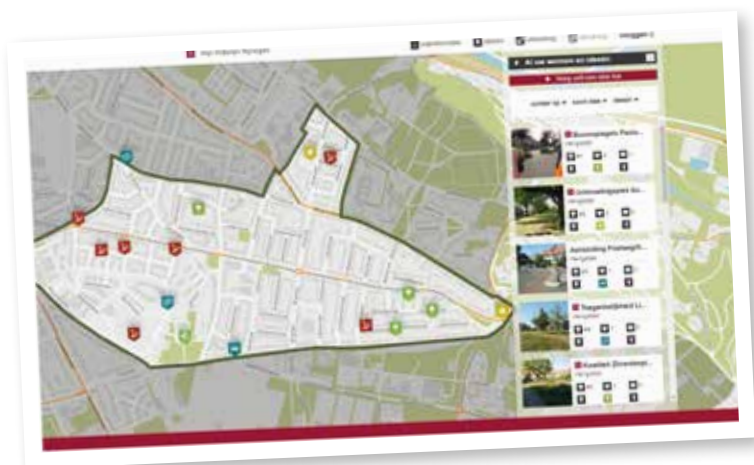
▲ Figuur 1: In elke wijk zijn de ideeën en voornemens, maar ook de geplande werkzaamheden buiten op straat zichtbaar.