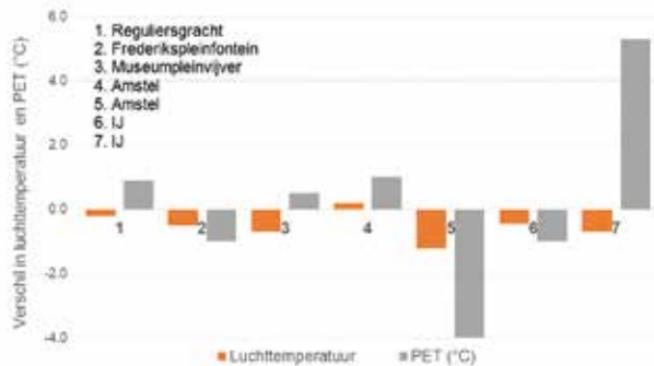
Figuur 2 Verkoelend effect van enkele specifieke wateren in Amsterdam. Een negatief verschil betekent dat de situatie met water koeler is.

2016 laten een beperkt verkoelend effect van een gracht, een fontein, een vijver en twee sloten of rivieren in Amsterdam zien (zie figuur 2). De luchttemperatuur in de buurt van het water was overdag over het algemeen 1 °C lager dan in een vergelijkbare stedelijke omgeving zonder water. Verschillen in de gevoelstemperatuur (PET) liggen tussen -4 en +5 °C. Dit geeft aan dat de thermische omstandigheden in de buurt van het water soms iets comfortabeler en soms iets oncomfortabeler zijn.