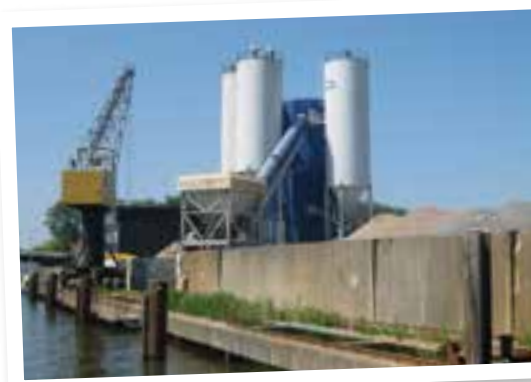
▲ Betonmortelcentrale in Diemen.

U kunt op donderdag 3 oktober tijdens Vakbeurs Openbare Ruimte een presentatie bijwonen over cementloos beton. Deze vindt plaats in het Future Green City Ideeëntheater van 15.00-15.30 uur. Zie www.openbareruimte.nl voor details en de meest actuele informatie.