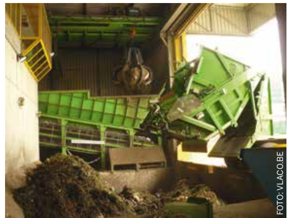
▲ Stortbunker voor gft-afval.

Op de stromen gft en KFF zijn wij tevreden met het resultaat: vijf waardevolle producten uit gft en 85 procent van het ingezamelde plastic hergebruikt. Ook met textiel hebben we een eerste succesvolle stap gezet. Met deze voorbeelden doen wij praktijkervaring op met samenwerkingsvormen, schaalgroottes én de manier waarop wij verantwoording afleggen aan onze klanten zodat ze betrokken blijven en weten welke resultaten er worden behaald.