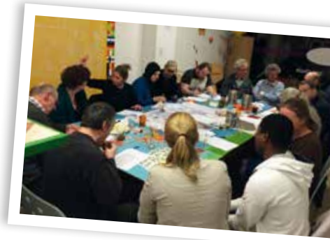
▲ Workshop met bewoners, maart 2015.

De stap pakt goed uit, de contacten met bewoners verbeteren. Daarnaast zet Krosse stappen om zichzelf overbodig te maken. Ze zet haar vacature uit in het lokale blaadje en bij Philip Morris, de sigarettenfabrikant die bezig is de fabriek in Bergen op Zoom te sluiten. Ook leidt ze via Thuis Op Straat (TOS) zes jongeren op die haar werk geleidelijk, via coaching, kunnen overnemen. Maar de belangrijkste stap moet nog gezet worden: het 'verkokerde' budget vrijmaken zodat bewoners erover kunnen beschikken. Maar juist dan, in de zomer van 2015, verandert het team. Twee belangrijke leden vertrekken en de corporatie krijgt te maken met strengere investeringsregels als gevolg van rijksbeleid (minister Blok). Bewoners (mee) laten beslissen over het budget is in deze omstandigheden een stap te ver. Teamleden vallen terug in hun vertrouwde rol van verantwoording van geormerkt geld. Krosse geeft de opdracht terug.