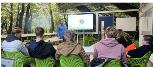
Diverse gastlessen, Meet-and-greets, Product-presentaties Voorlichtingen

De bezoeken aan diverse daktuinen, uitleg over soorten dak, veiligheid... en natuurlijk ook wat actie!