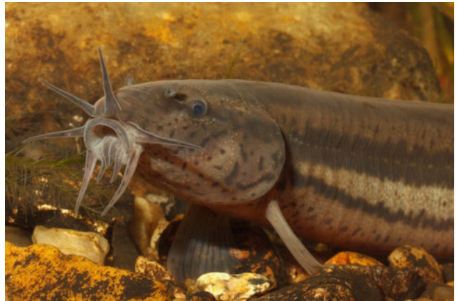
Grote modderkruiper ( Misgurnus fossilis )