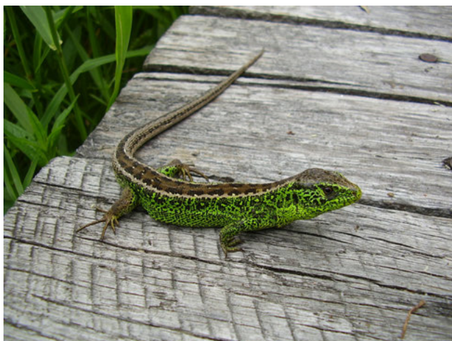
Zandhagedis ( Lacerta agilis )