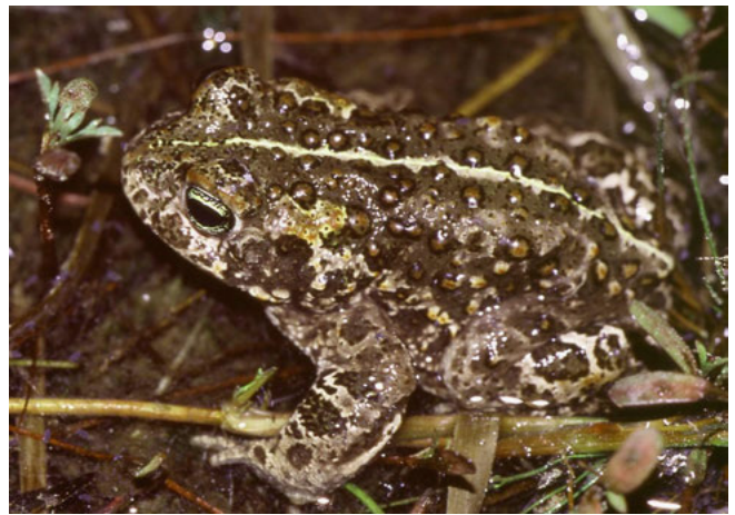
Rugstreeppad (Bufo calamita)

De Wet natuurbescherming biedt de mogelijkheid om een programmatische aanpak ook toe te passen binnen het soortenbeleid. In lijn met de inzet voor het toekomstige omgevingsrecht en het streven om economie en ecologie meer met elkaar te verbinden, wordt de programmatische aanpak breed inzetbaar voor Natura 2000-gebieden en voor het soortenbeleid. Een dergelijk programma kan zowel door het Rijk als door provincies worden opgesteld.