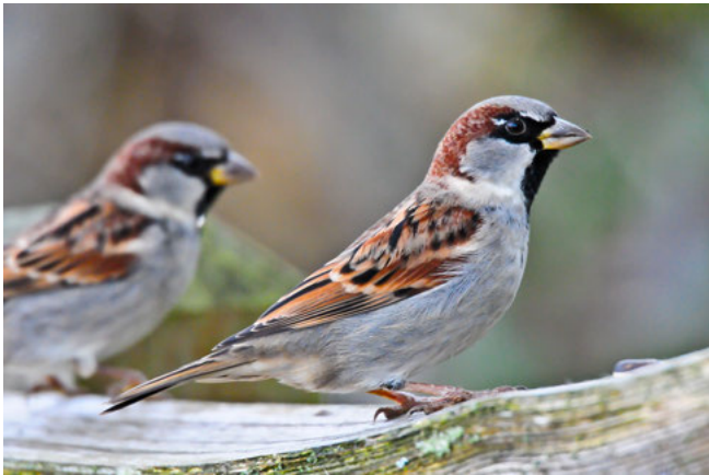
Huismus ( Passer domesticus )