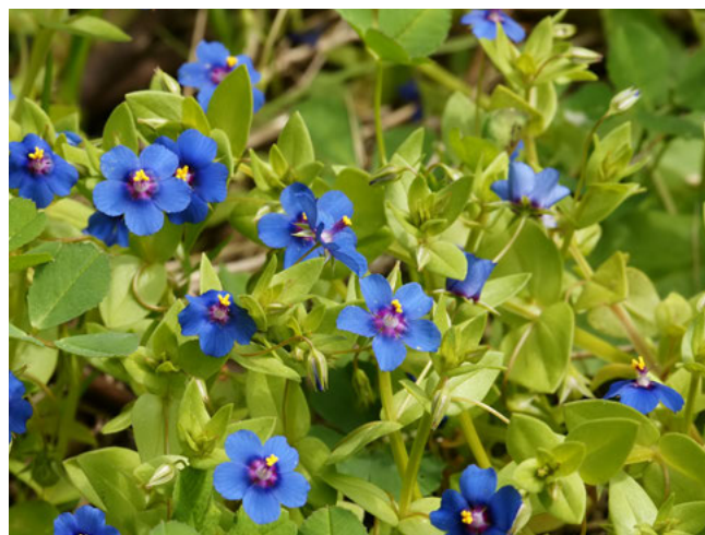
Blauw guichelheil ( Anagallis arvensis foemina )