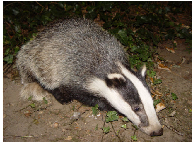
Das ( Meles meles )

Het aantal exemplaren van een beschermde inheemse soort dat in een bepaald geval verstoord wordt, is voor de vraag óf het verbod op verstoring overtreden wordt niet relevant, ook niet indien er geen afbreuk wordt gedaan aan de staat van instandhouding van de soort 2) . Anderzijds hoeft niet iedere handeling die tot gevolg heeft