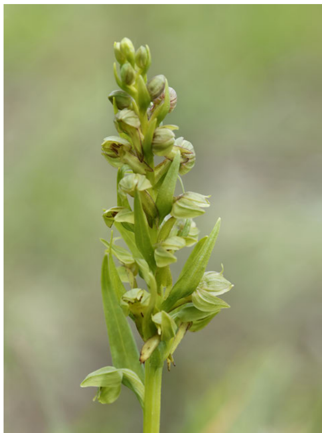
Groene nachtorchis ( Coeloglossum viride )

Om te bepalen of strikt beschermde soorten dan wel hun voortplantings- en rustplaatsen of nesten voorkomen kunt u de hulp inschakelen van een ecologisch deskundige. U kunt ook de Nationale Databank Flora en Fauna raadplegen.