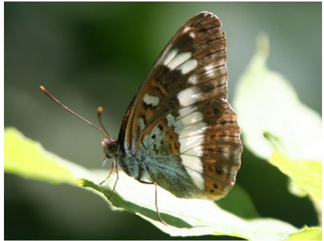
Kleine ijsvogelvinder ( Limenitis camilla )

Maatregelen die de effecten op de plek van handeling herstellen, zijn mitigerend van aard; maatregelen die de effecten voor de populatie opheffen door herstel of verbetering op een andere plek zijn compenserend van aard. Overigens wordt bij soortenbescherming geen scherp onderscheid gemaakt tussen mitigerende en compenserende maatregelen (dit in tegenstelling tot gebiedenbescherming). Belangrijk is dat de staat van instandhouding gegarandeerd wordt.