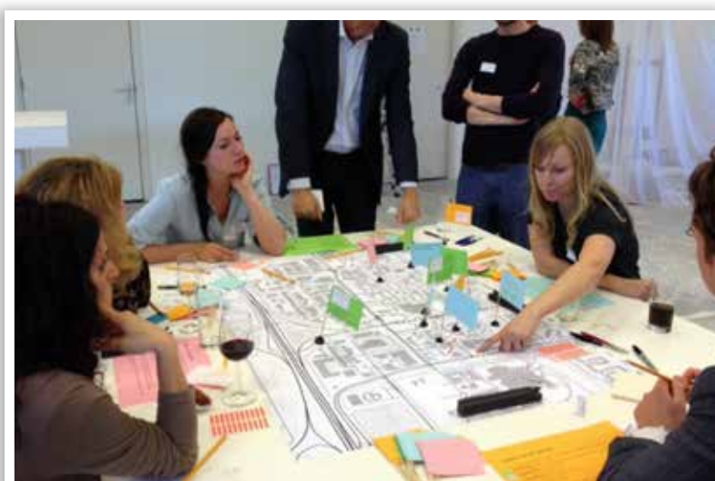
▲ Input voor de Sociale Contextkaart: een digitale tool die sociaal-ruimtelijk locatieonderzoek snel en makkelijk toegankelijk maakt.

Placemakers is betrokken bij De Buurtcamping vanaf de eerste editie in het Amsterdamse Oosterpark in 2013. Het initiatief is sindsdien gegroeid naar dertien campings met ruim 2.000 kampeerders in 2017, in